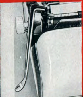
Abb. 1 Der Zeilenschaltthebel bewirkt das Schalten der Zeilenabstände 4,25, 6,375 oder 8,5 mm. Vorgewählt wird der jeweilige Zeilenabstand mittels Zeileneinstellhebel.